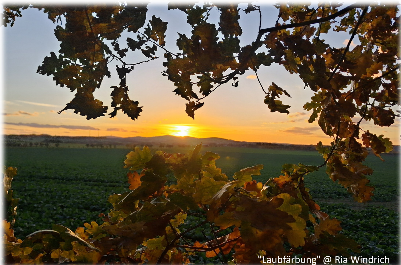
"Laubfärbung" @ Ria Windrich