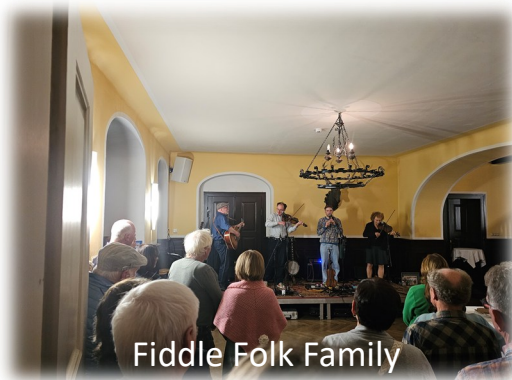
Fiddle Folk Family

Über die Getränkebeschaffung, den Bühnenaufbau, das Herrichten von Tischen und der Bestuhlung und am Montag dann wieder das Aufräumen - alles war bestens.