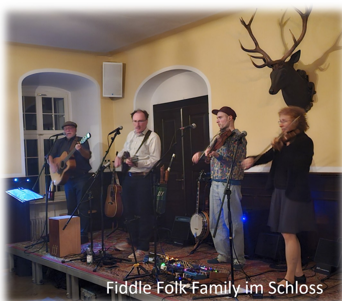
Fiddle Folk Family im Schloss