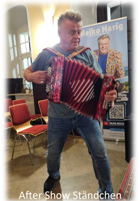
After Show Ständchen