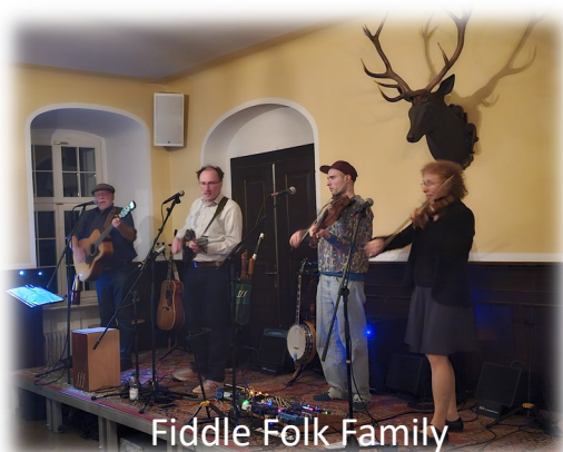
Fiddle Folk Family

Unsere Tanzveranstaltungen im Mai und im Herbst sind mittlerweile feste Größen